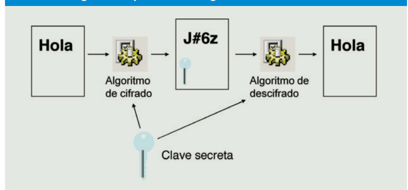
Figura 1. Esquema de los algoritmos de clave secreta

un crackeador de código DES capaz de descifrar mensajes DES en menos de 3 días.