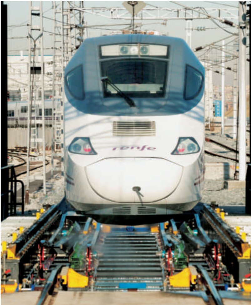
Los cambiadores de ancho Talgo entraron en servicio comercial en 1969, y desde entonces han pasado por ellos cerca de 100.000 trenes sin ninguna incidencia significativa. Los nuevos cambiadores (como el de Santa Catalina en la foto) permiten pasar a trenes completos (es el caso del 130) y por ello tienen catenaria. El tren no se detiene, reduce la velocidad a unos 20 km/h y los viajeros sólo notan como si el tren pasara por un puente metálico.

posibilidad de extender el ancho internacional a toda la red Española o a una parte significativa de ella.