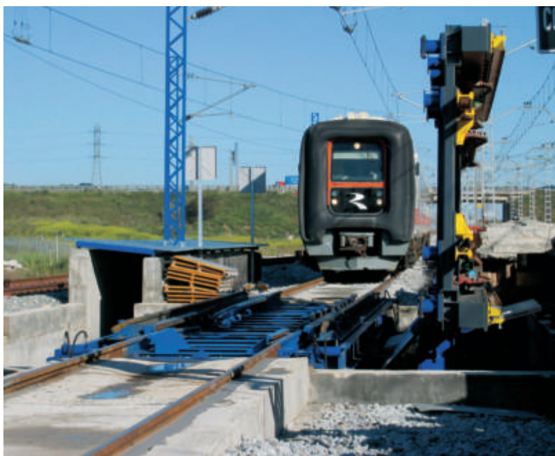
El bogie Brava de cambio de ancho de CAF nació en 2000 con su aplicación a un tren diesel de la serie 594, como el que aparece en la foto en el cambiador de Zaragoza a punto de pasar del ancho internacional al ancho ibérico.

Con estos nuevos criterios se diseñan los cambiadores de Plasencia de Jalón (para los trenes de Madrid a Pamplona, Irún, Logroño y Vitoria), Zaragoza Delicias (para futuros trenes transversales del Norte, complementándose con otro previsto en Miraflores), Huesca (trenes Zaragoza-Jaca), Puigverd de Lleida (trenes Alvia de Madrid a Barcelona), Madrid-Santa Catalina (complemento al taller de trenes de ancho variable), Antequera-Santa Ana (Madrid a Málaga, Granada y Algeciras) y Roda de Bará (Madrid a Barcelona), que constituyen la que podríamos denominar tercera generación de cambiadores. El cambiador provisional de Lleida, aunque está en la línea de Madrid a Barcelona, puede considerarse de la segunda generación, puesto que fue proyectado y construido con los mismos criterios que los de la línea de Madrid a Sevilla.