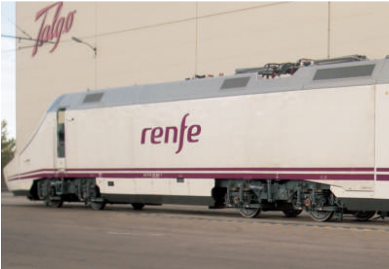
El tren de la serie 130, desarrollado por Talgo, permite al tren completo pasar por el cambiador. Estos trenes, que pueden alcanzar los 250 km/h, han comenzado sus pruebas en 2006, y con el 120 de CAF están llamados a llevar el peso de los principales servicios de viajeros en los próximos años en los que coexistirán tramos parciales de las nuevas líneas de alta velocidad con la red convencional. (Foto: Gonzalo Rubio).

mantener la continuidad del hilo de contacto. Con los trenes autopropulsados, sí que es preciso asegurar que el pantógrafo no se despegue, si bien como es lógico, mientras está pasando por el cambiador no toma energía