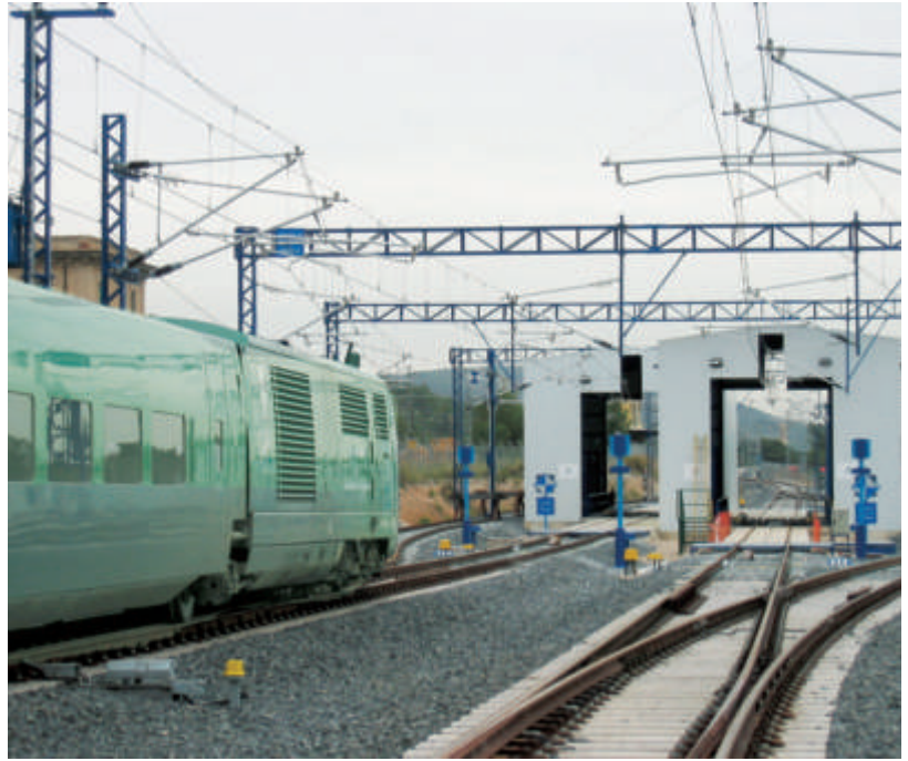
Gracias a los nuevos cambiadores de ancho (en la foto los dos cambiadores duales de Roda de Bará) y a los trenes de ancho variable (en la foto el tren ascultador de Adif) es posible extender los beneficios de la alta velocidad al conjunto de la red. De hecho, el tren Talgo diésel de la foto podría circular por toda la red ferroviaria europea, desde Algeciras a Estambul, por ejemplo.

Por lo que se refiere a las locomotoras convencionales un consorcio liderado por Talgo (que además construyó la parte mecánica), y en que participan las empresas Ingelectric y Team construyó una máquina de ancho variable capaz de alcanzar los 260 km/h, que fue probada desde diciembre de 2003. La máquina tiene una masa de 18,5 t por eje; cuenta con dos bogies, cada uno con dos ejes, y cada eje es accionado por un motor eléctrico trifásico asíncrono.