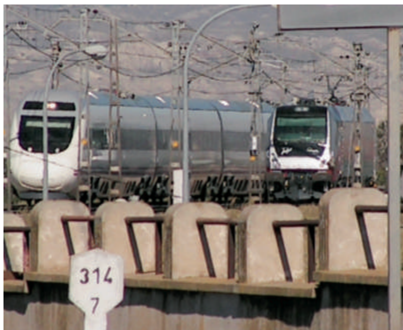
Tanto Talgo como CAF han desarrollado sistemas de cambio de ancho automáticos para trenes de viajeros. En la foto (Grisén, 2006) aparece el tren de CAF (serie 120) y la locomotora experimental de Talgo-Team numerada L9202.

• Catenaria: Una novedad muy visible de los nuevos cambiadores es que la catenaria pasa por ellos, ya que se debe garantizar la continuidad del hilo de contacto, porque los pantógrafos pueden estar en todo momento en contacto él. Esta necesidad no se produciría en los cambiadores clásicos, ya que al cambiar la máquina, aunque ésta fuera eléctrica en ambos lados, la máquina no pasaba por el cambiador; por lo que no era necesario