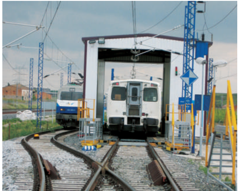
En los primeros cambiadores (como es el de Lérida que aparece en la foto) podía pasar el tren, pero no la máquina que debía reemplazarse en el cambiador. Esto se ha mejorado recientemente y en la actualidad ya pueden pasar máquinas y trenes completos.

primeros trenes comerciales y se construyó, ya con vistas a su explotación regular, un cambiador en PortBou. Por este cambiador, el día 1 de junio de 1969 comienza a circular regularmente el Tren Talgo III RD que unía Barcelona con Ginebra. Desde mayo de 1974 circula, además, por el cambiador de Portbou el tren Talgo de camas que cubre la ruta de Barcelona a París. Este tren continúa circulando, explotado por la agrupación hispano francesa Elypsos, con el nombre de Joan Miró. En mayo de 1981 se puso en servicio otro cambiador en Irún, para permitir el paso del tren Talgo RD (este Pendular) que unía Madrid con París en 13 horas. Este tren sigue circulando y es explotado también por Elypsos con el nombre de Francisco de Goya.